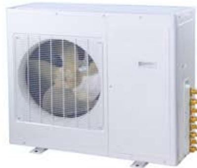
Multi-INV-24 / Multi-INV-28